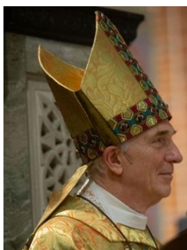
Emeritus bisschop Joris Vercammen