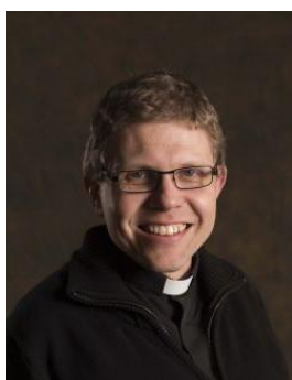
Bisschop-elect Bernd Wallet (Utrecht)